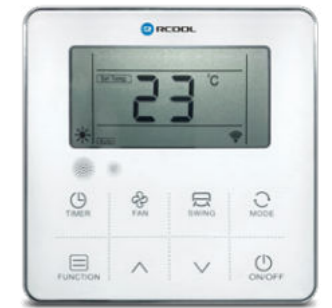
Erintésérzékeny vezetékes távirányító (alap tartozék)