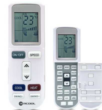
Nyitható távirányító extra funkciókkal