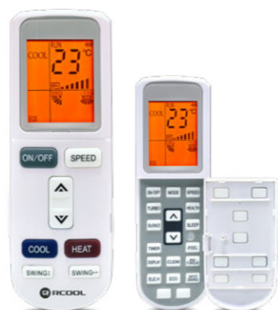
Nyitható távirányító háttérvilágítással