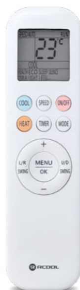
Letisztult távirányító háttérvilágítással