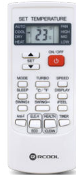
Könnyen kezelhető távirányító