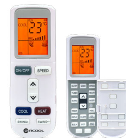
Nyitható távirányító háttérvilágítással