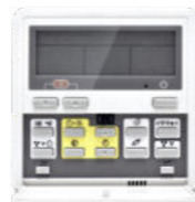
Vezetékös távirányító (opcionális)